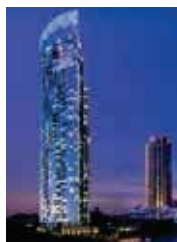
• The River