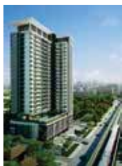
• The Room Sathorn